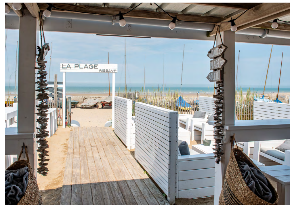
Vue sur mer et pieds dans le sable au bar La Plage à Wissant !

par Ludivine FASSEU | Reportage : Sabrina KWIATKOWSKI